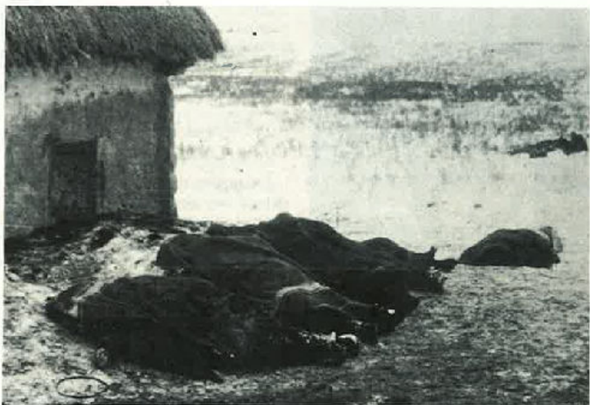
Steppa Russa, 20 dicembre 1942: i primi Caduti del Btg. L'Aquila.

tà di rivincita, quella stessa realtà sociale — e qui rischio di dire una bestialità, ma lo faccio assumendome la responsabilità — che non è degna di essere uscita indenne da una guerra ad assumere questi atteggiamenti di sfida; sono coloro che autodefinendosi "uomini" hanno avuto tutto e per questo sono appagati fino alla nausea da quanto ha loro offerto una vita non certo di sacrificio e privazioni e si sentono già stanchi magari solo perché già arrivati alla soglia dei 20 anni.