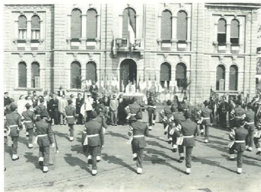
Mogliano: un particolare della cerimonia alla presenza di autorità, Alpini e Fanfara della Orobica.

Gli interventi successivi hanno esaltato l'alto valore civico e morale del tricolore, simbolo vivo di unità di fratellanza e di pace, per il quale milioni di italiani, in esso identificati, hanno sofferto di drammatici eventi delle guerre che hanno mutato la vita del nostro Paese. Gli alpini hanno così voluto dedicare questa giornata soprattutto a coloro che non hanno vissuto quei momenti, e cioè ai giovani di oggi, perchè quelle pagine della nostra storia siano per loro più vi-