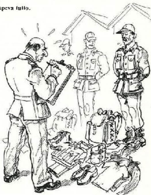
La rivista corredo: si salvi chi può.