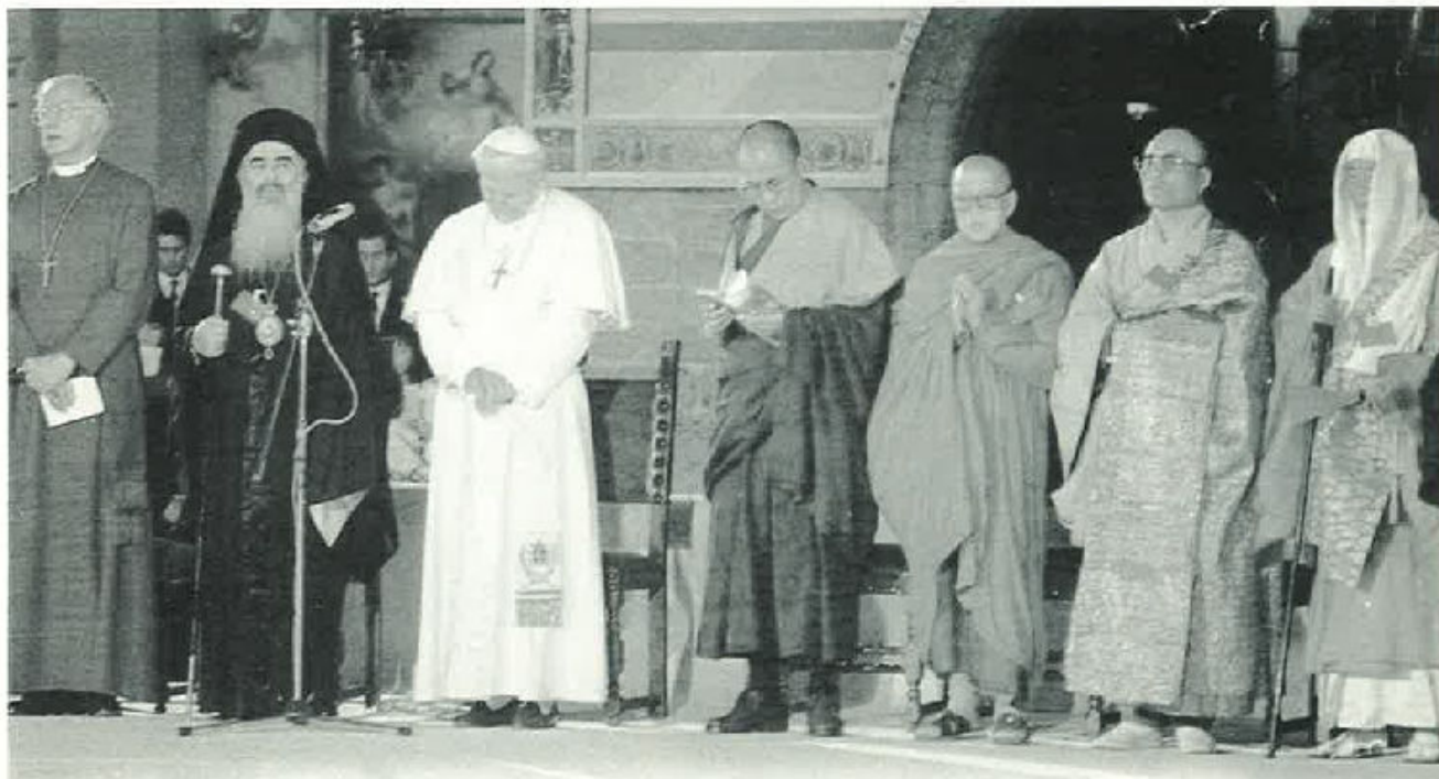
Giovanni Paolo II° mentre prega per la pace in tutto il mondo, assieme ai rappresentanti delle altre 63 Chiese convenuti ad Assisi.

Ecco dunque perché la scelta di Assisi, quell'Assisi Patria di S. Francesco ovunque riconosciuto come un Uomo di