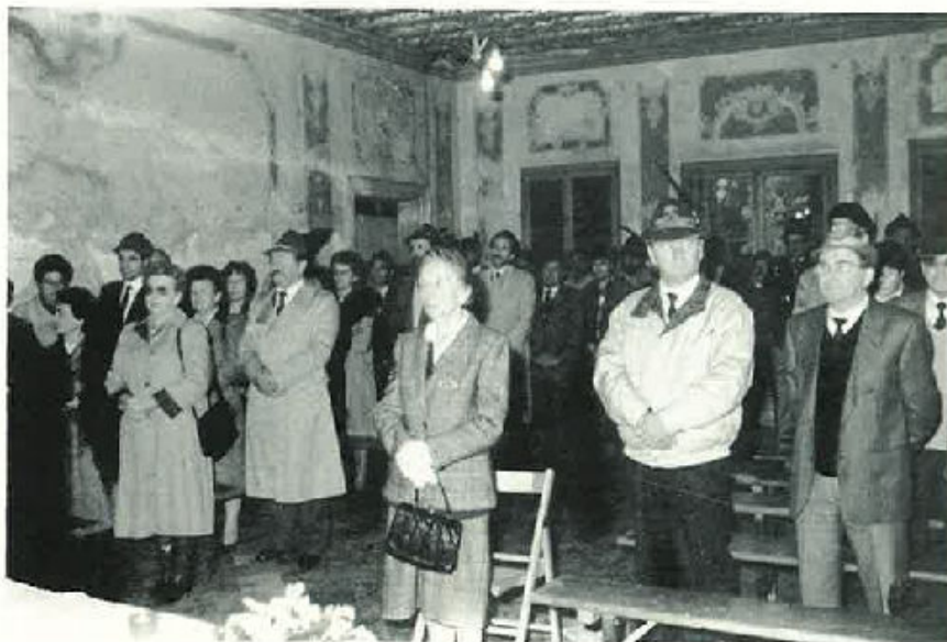
Treviso-Salsa: i partecipanti durante la S. Messa per i Caduti.