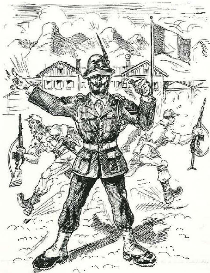
Il caporale istruttore: l'uomo che sapeva tutto.

Dona sangue, difenderai la tua vita e aiuterai quella degli altri.