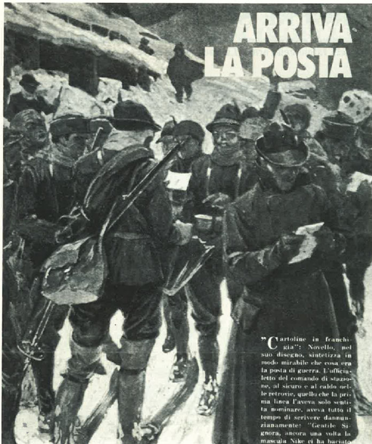
Il momento felice della distribuzione della posta, sempre tanto atteso e sospirato, specialmente dagli Alpini al fronte, lontani dalla Patria e dalle loro famiglie.

La tracotanza nemica è doma!...? Si sentiva un eroe.