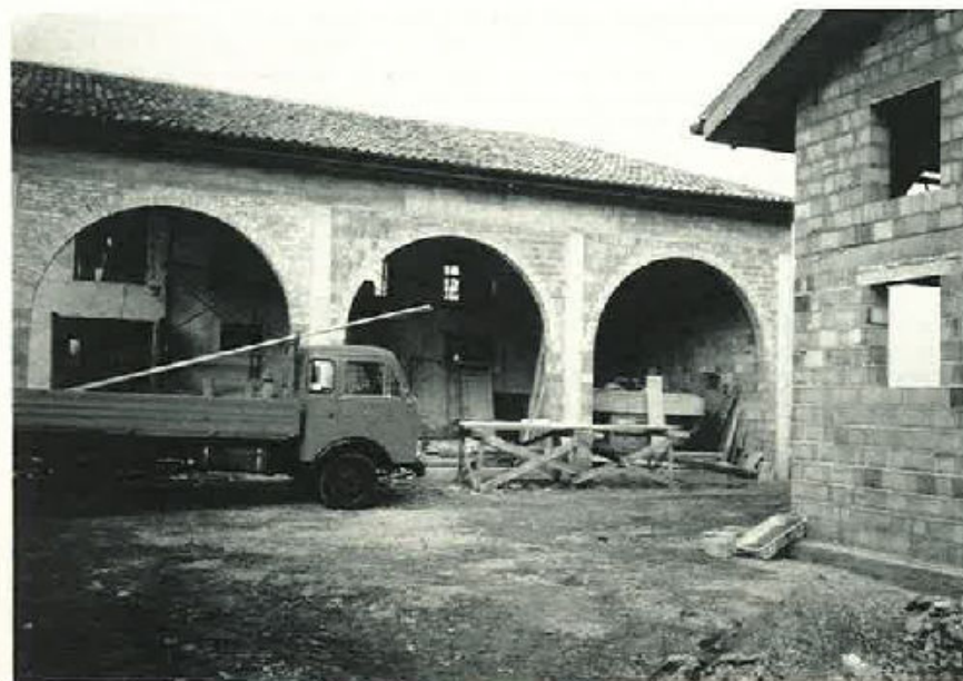
Un particolare delle costruzioni fatte ex novo: la tettoia ed il «barco».

A dire il vero avrei voluto incontrare tanti altri Alpini altri gruppi della Vostra Associazione che sono lontani e assenti da questi problemi, non per contrarietà, ma per paura o disinformazione o disorganizzazione.