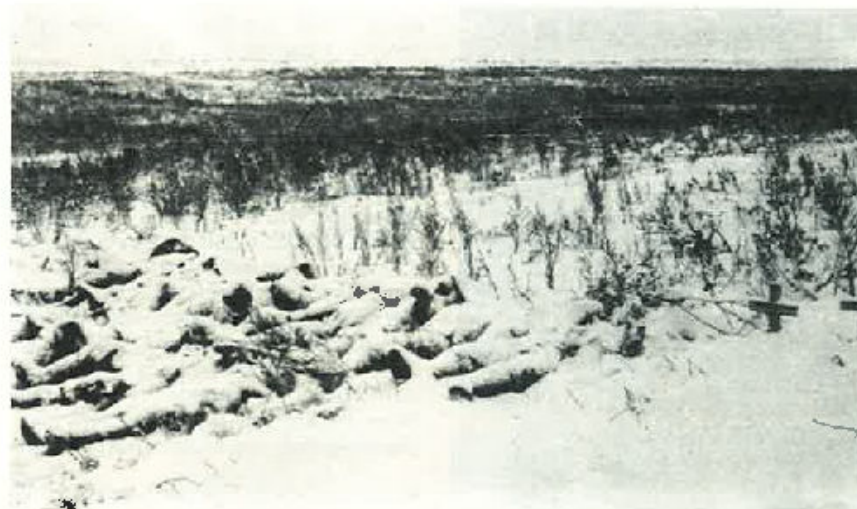
Un'altra immagine di morte: un gruppo di Caduti ormai semisepolti dalla neve.

Questi Alpini che giungono a Cison, al Bosco delle Penne Mozze, vivono quotidianamente in questa dimensione umana che agli occhi di molti si manifesta quasi incredibile, in quanto il mondo odierno sembra assetato solo delle peggiori nefandezze che la mente umana possa concepire. I valori di Patria e Famiglia vengono derisi, le bandiere strapagate ed incendiate, i monumenti imbrattati con slogans che inneggiano alla vendetta e che mortificano gli animi, abbassando gli autori al rango di bestie. È la moderna realtà consumistica che si propone solo la distruzione senza possibili-