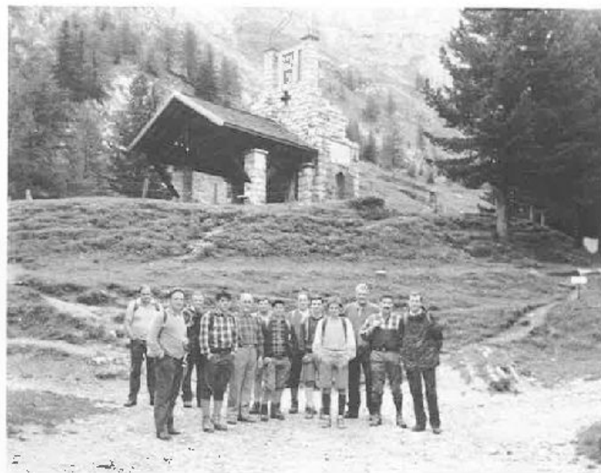
Cornuda: gli escursionisti al Rifugio Contrin.

Questo è stato un primo esperimento e, dato l'entusiasmo suscitato, certamente anche nel 1987 sarà ripreso.